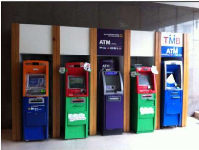
ตู้ฝากถอนเงินสด

ตัวอย่างสิ่งปลูกสร้างที่อยู่ในข่ายได้รับการยกเว้นภาษี