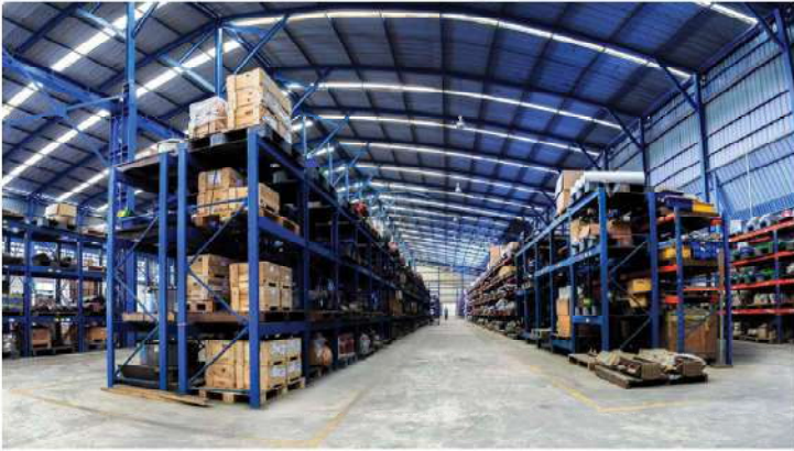
คลังสินค้า