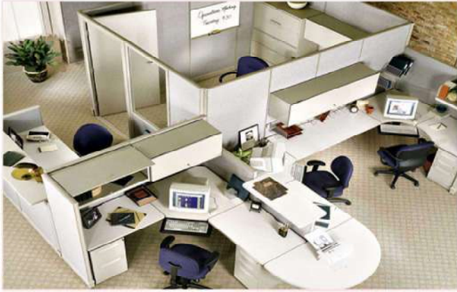
สำนักงาน