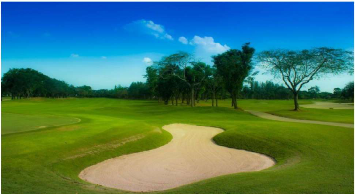
สนามกอล์ฟ จัดเป็นธุรกิจการกีฬา จึงได้รับการลดภาษี

1.4 ลดภาษีร้อยละ 90 ของจำนวนภาษีที่จะต้องเสียของทรัพย์สินที่ใช้เป็นสถานที่เล่นกีฬา สวนสัตว์ สวนสนุก หรือที่จอดรถสาธารณะ