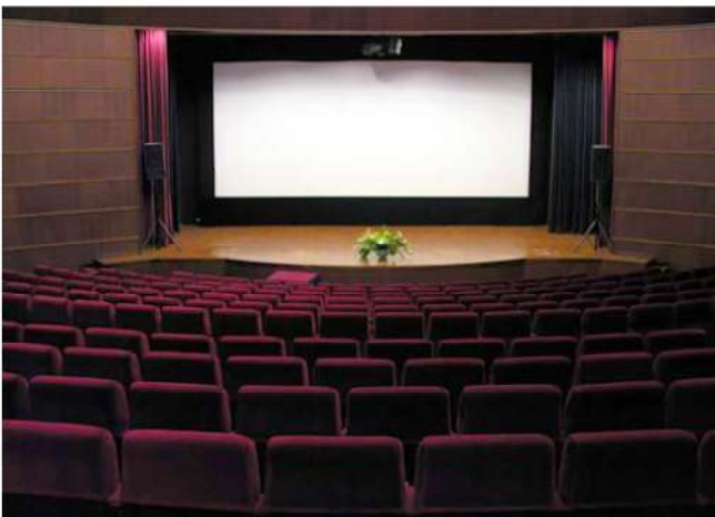
โรงมหรสพ