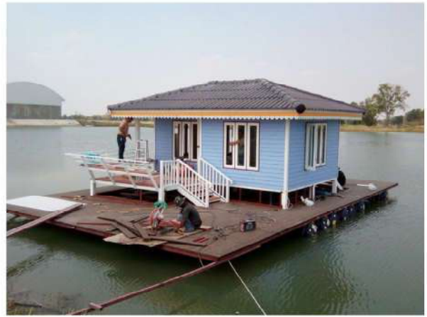
บ้านเรือนแพ