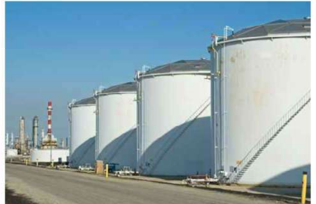
ถังเก็บน้ำมันบนดิน