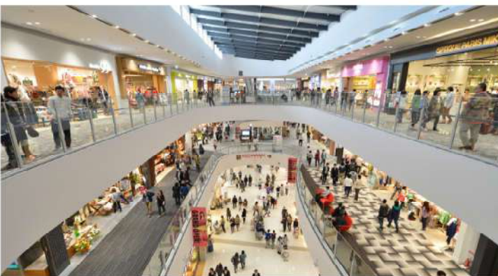
ห้างสรรพสินค้า