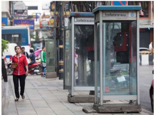
ตู้โทรศัพท์สาธารณะ