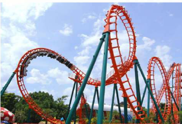
เครื่องเล่นในสวนสนุก