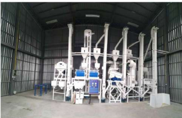
โรงสีข้าว