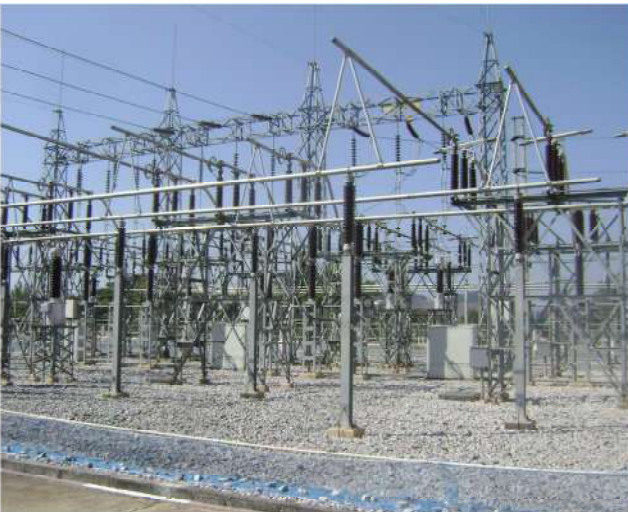
ลานไถไฟฟ้า