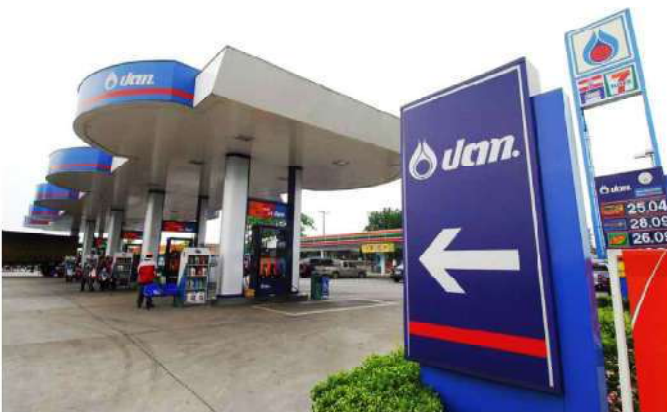
สถานีบริการน้ำมัน