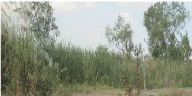
ที่ดินรกร้างไม่ได้ใช้ประโยชน์

(2) ที่ดินที่ไม่เป็นกรรมสิทธิ์ของบุคคลธรรมดาหรือนิติบุคคล แต่อยู่ในความครอบครองของบุคคลธรรมดาหรือนิติบุคคล เช่น สปก. 4, ก.ส.น., ส.ค.1, นค.1, นค.3 ส.ท.ก.1 ก, ส.ท.ก.2 ก, นส.2 (ใบจอง) และที่ดินอันเป็นทรัพย์สินของรัฐ ซึ่งมีการเข้าไปครอบครองหรือทำประโยชน์ ฯลฯ เป็นต้น