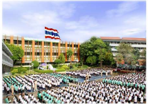
สถานศึกษา