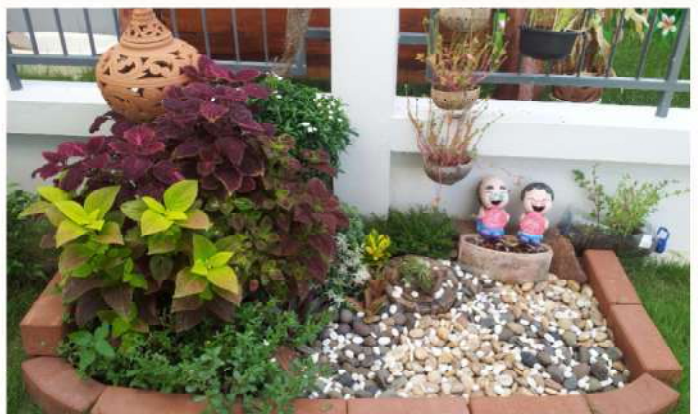
สวนหย่อม