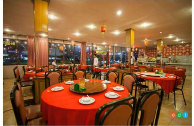
ภัตตาคาร