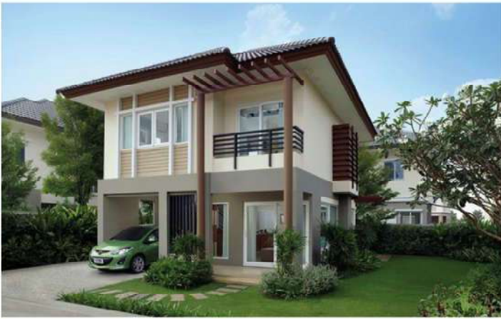
บ้านเดี่ยว