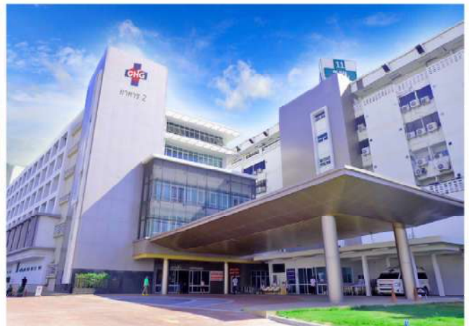
สถานพยาบาล