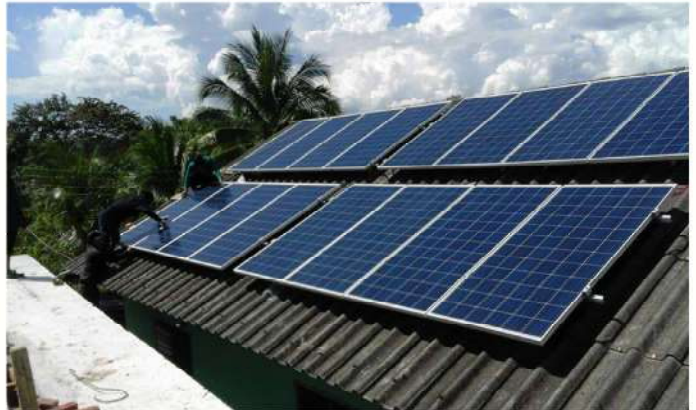
แผงโซลาร์เซลล์