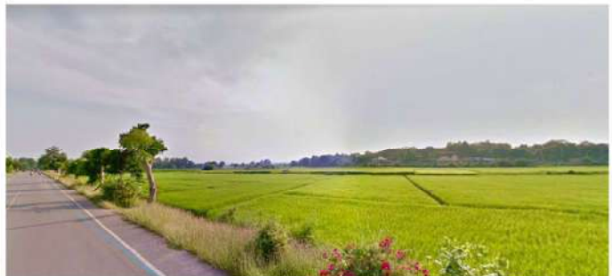
ที่ดินที่ใช้ทำกสิกรรม