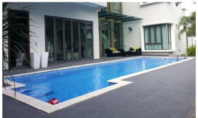
สระว่ายน้ำ