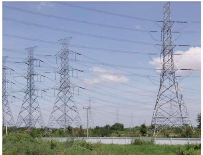
เสาไฟฟ้า