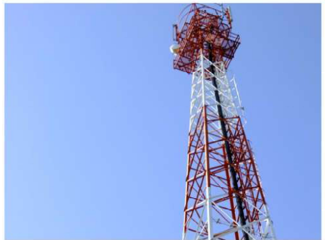
เสาส่งสัญญาณอินเทอร์เน็ต