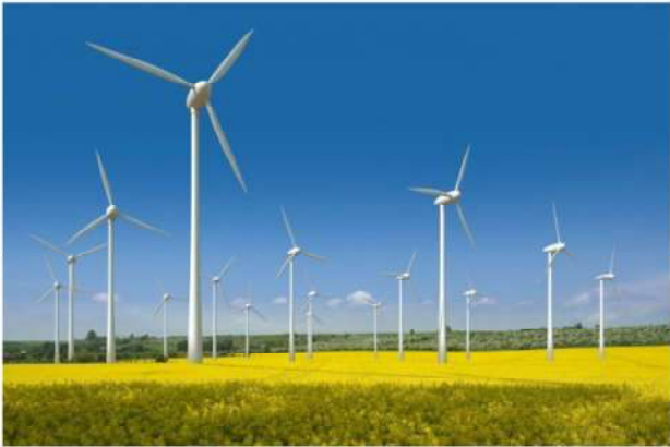
กังหันลม

ตัวอย่างสิ่งปลูกสร้างที่อยู่ในข่ายได้รับการยกเว้นภาษี