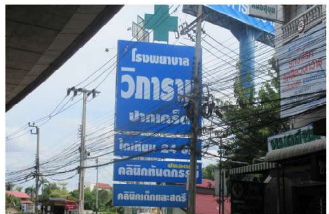
ตัวอย่างป้ายที่ต้องเสียภาษี

หากในกรณีที่ไม่มีผู้มายื่นแบบแสดงรายการภาษีป้าย หรือเจ้าหน้าที่ไม่สามารถติดต่อหรือหาตัวเจ้าของป้ายได้ ให้ถือว่าผู้ครอบครองป้ายมีหน้าที่เสียภาษีป้าย แต่ถ้าหาตัวผู้ครอบครองป้ายไม่ได้ เจ้าของหรือผู้ครอบครองที่ดินที่ติดตั้งป้ายจะต้องเป็นผู้เสียภาษีป้ายแทน ตามลำดับที่กล่าวมา