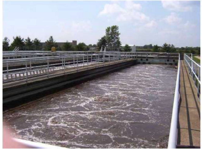
บ่อบำบัดน้ำเสีย