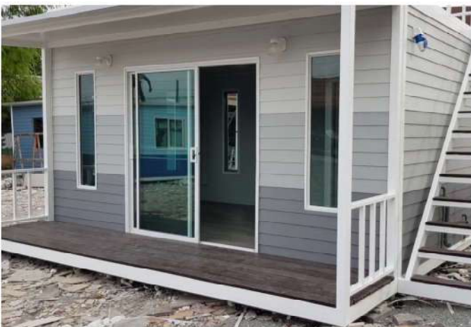
บ้านประกอบเสร็จ