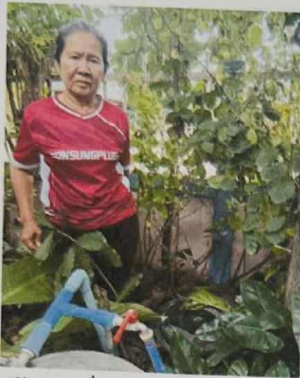
ครัวเรือนที่ 89