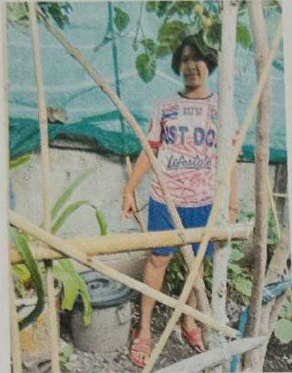
ครัวเรือนที่ 80